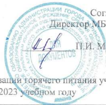
График проведения родительского контроля по организации горячего питания учащихся МБОУ СОШ № 15 г. Заринска в 2022 – 2023 учебном году